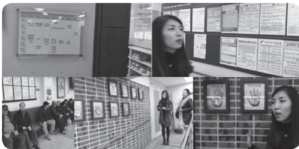
ภาพที่ 8 การพัฒนาทางสังคมใช้วิธีสร้างแรงจูงใจทั้งบุคคลต้นแบบ และตัวผู้สูงอายุ

• สวัสดิการด้านการพัฒนาทางสังคม ศูนย์ผู้สูงอายุ มีพื้นที่ที่ให้ผู้สูงอายุที่มีความสามารถที่จะถ่ายทอดความรู้ด้านต่าง ๆ อาทิเช่นภาษาต่างประเทศ อังกฤษ จีน ญี่ปุ่น เมื่อมีความรู้เพิ่มขึ้นก็สามารถที่จะช่วยเหลือชุมชนในด้านการให้รายละเอียดของการท่องเที่ยว แก่นักท่องเที่ยวชาวต่างชาติ นั้น ๆ ได้ ซึ่งเป็นการส่งเสริมการแบ่งปันความรู้เพื่อพัฒนาสังคมของผู้สูงอายุซึ่งผู้สูงอายุที่ปฏิบัติหน้าที่เป็นผู้สอนในลักษณะจิตอาสาจะเกิดความรู้สึกภาคภูมิใจในการให้ความรู้และประพฤติตนเป็นประโยชน์กับผู้อื่น