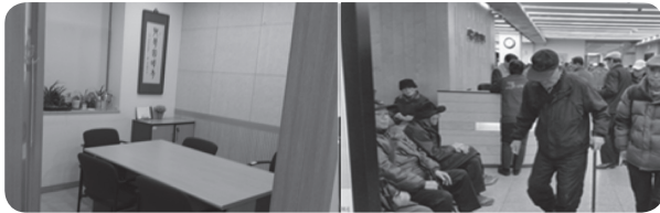
ภาพที่ 7 ห้องให้คำปรึกษาในด้านครอบครัว สุขภาพจิต และกฎหมาย และการให้บริการสุขภาพ

• สวัสดิการด้านการพัฒนาจิตใจ ศูนย์ผู้สูงอายุได้จัดห้องประชุมมอรรณเพื่อให้ข้อมูลก่อนเป็นสมาชิกของศูนย์ และห้องพูดคุยปัญหาต่าง ๆ ของผู้สูงอายุ อาทิ ปัญหาการหย่าร้างกันของผู้สูงอายุที่มีจำนวนเพิ่มขึ้นจากอดีต ปัญหาทางกฎหมายต่าง ๆ อาทิ การเสียภาษี ปัญหาทางด้านจิตใจที่เป็นสาเหตุของการเกิดโรคซึมเศร้าในผู้สูงอายุ อีกทั้งการสร้าง ความเข้าใจ เตรียมพร้อม และยอมรับในด้านการเป็นผู้สูงอายุ โดยผู้เชี่ยวชาญเฉพาะทางเป็นผู้ให้คำปรึกษา ส่วนใหญ่เป็นเจ้าหน้าที่ที่เป็นนักสังคมสงเคราะห์