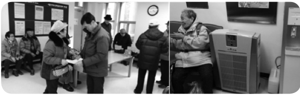
ภาพที่ 3 บรรยากาศของพื้นที่สำหรับการบริการการทำงานทำของผู้สูงอายุที่ศูนย์สวัสดิการผู้สูงอายุ

มีแผนนี้เพื่อตอบสนองผู้สูงอายุที่ต้องการมีรายได้ โดยแบ่งประเภทของงานที่เหมาะสมกับผู้สูงอายุออกเป็น 2 ประเภท คือ ประเภทที่ต้องมีการจัดให้มีการอบรมเพื่อเรียนรู้งานก่อน อาทิเช่น การทำงานร้านกาแฟกับงานประเภทที่ไม่ต้องจัดให้มีการอบรมก็สามารถทำงานได้เลย อาทิเช่น งานทำความสะอาด โดยลักษณะของงาน โดยมีการเชิญผู้เชี่ยวชาญตามลักษณะของงานมาให้ความรู้และฝึกอบรม โดยเน้นที่ความสนใจส่วนบุคคลของผู้สูงอายุ โดยจัดให้มีตารางการฝึกอบรมตามทักษะต่าง ๆ ของงานเป็นรายปี ผู้สูงอายุที่ต้องการเข้าอบรมเรื่องใดก็มาลงทะเบียนไว้