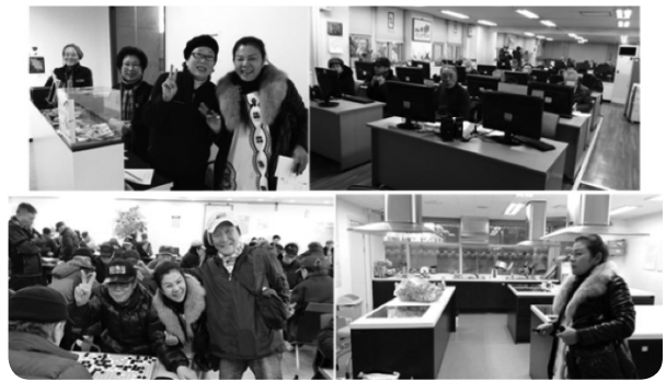
ภาพที่ 6 พื้นที่การจัดกิจกรรมเพื่อส่งเสริมสนับสนุนการพัฒนาสติปัญญาของผู้สูงอายุที่เป็นสมาชิก

• สวัสดิการด้านการพัฒนาสติปัญญา ศูนย์ผู้สูงอายุได้จัดให้มีศูนย์การสอนและแสดงศิลปะที่มีสมาชิกเป็นบุคคลทั่วไป รวมถึงผู้สูงอายุของศูนย์เอง มีการจัดสอน และนำมาจัดแสดงผลงานภายในศูนย์ศิลปะนี้ด้วย อีกทั้งยังมีบริการห้องสมุดเคลื่อนที่ที่ผู้สูงอายุสามารถใช้บริการได้ รวมถึงผู้มาใช้บริการสวนสาธารณะทับบอกวงวอนที่เป็นสถานที่มรดกแห่งชาติของสาธารณรัฐ เกาหลีก็สามารถใช้บริการห้องสมุดเคลื่อนที่ นี้ได้เช่นกัน อีกทั้งนักศึกษาในบริเวณนี้ก็สามารถใช้บริการได้โดยการเป็นสมาชิกในการเช่า ยืม คีนหนังสือหรือสื่อต่าง ๆ ได้ และทักษะด้านเทคโนโลยี จะมีพื้นที่และ