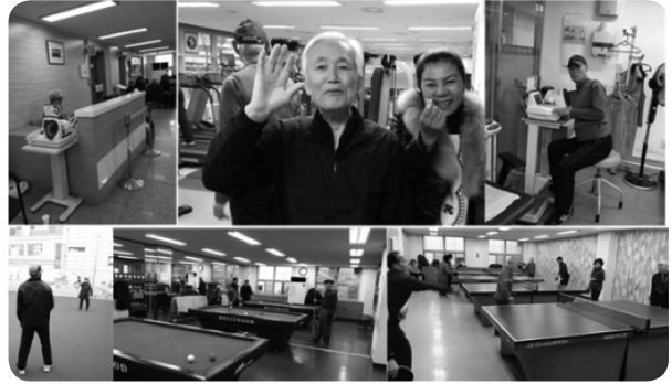
ภาพที่ 5 การให้บริการด้านสวัสดิการด้านการพัฒนาร่างกายด้วยกิจกรรมต่าง ๆ

• สวัสดิการด้านการพัฒนาร่างกาย ทางศูนย์จะให้ความสำคัญในด้านการดูแลสุขภาพของผู้สูงอายุนั้น จะมีแพทย์ประจำที่ศูนย์นี้ 2 ท่านต่อ 1 วัน ดูแลทั้งด้านการรักษาและการป้องกันสุขภาพของผู้สูงอายุด้วย อีกทั้งยังมีการส่งเสริมทักษะด้านการกีฬาเพื่อสุขภาพ โดยมีพื้นที่ลานกีฬาสำหรับผู้สูงอายุที่ชอบการออกกำลังกายกลางแจ้งก็จะมีลานกีฬากลางแจ้ง พื้นที่ทำสวนให้