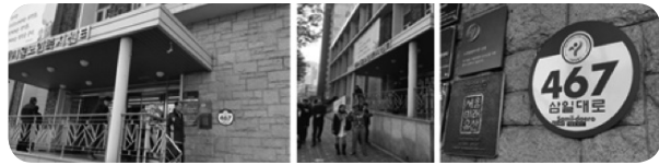
ภาพที่ 1 ศูนย์สวัสดิการผู้สูงอายุของมหานครโซล (The Senior Welfare Center of Seoul)