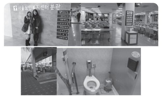
ภาพที่ 2 แผนกต่าง ๆ ที่ให้บริการอยู่ในบริเวณศูนย์สวัสดิการผู้สูงอายุของมหานครโซล

ระยะทาง ศูนย์แห่งนี้จะมีบริการรถรับส่งที่เป็นรถโดยสาร และมีสถานีรถไฟใต้ดินอยู่หน้าศูนย์จึงสะดวกในการ เดินทางทำให้มีผู้สูงอายุเป็นจำนวนมาก ในปัจจุบันมีบันได เลื่อนที่ได้รับการงบประมาณสนับสนุนจากภาครัฐ นอกจากนั้น ศูนย์ผู้สูงอายุจัดให้มีการให้บริการอาหารกลางวันฟรี จน กระทั่งถึงปี 2014 เพื่อลดภาระด้านงบประมาณโดยให้เกิด การร่วมรับผิดชอบภาระค่าอาหารกลางวัน ผู้สูงอายุที่เป็น สมาชิกจะต้องจ่ายค่าอาหารกลางวันด้วยตนเองวันละ 1,000 วอนเกาหลี แต่ปริมาณอาหารและคุณภาพทางโภชนาการ นั้นมูลค่ามากกว่า 1,000วอนเกาหลี สำหรับผู้สูงอายุที่ ไม่สามารถจ่ายค่าอาหารจำนวนนี้ได้ก็จะได้รับบริการฟรี ในส่วนนี้เป็นรายกรณีไปและส่วนใหญ่เงินค่าอาหารที่ ให้ บริการแก่ผู้สูงอายุเป็นเงินที่ได้รับบริจาคจากผู้มีจิตศรัทธา ทั่วไปและผู้สูงอายุที่เป็นสมาชิกของศูนย์ ในส่วนพื้นที่การ ให้บริการอาหารกลางวันของศูนย์นี้อาจจะยังไม่เพียงพอต่อ การให้บริการเนื่องจากมีผู้สูงอายุรับบริการ 2,540 คนต่อวัน จึงต้องจัดการการให้บริการเป็นรอบ ๆ รอบละประมาณ 300 คน และค่าใช้จ่ายในการดำเนินงานในด้านเอกสารนั้นจะ ได้รับการสนับสนุนจากภาครัฐ