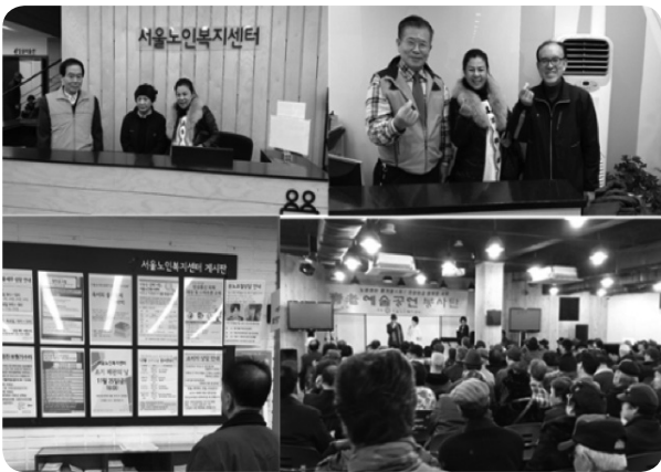
ภาพที่ 4 เจ้าหน้าที่จะเป็นผู้สูงอายุที่เป็นสมาชิกของศูนย์สวัสดิการผู้สูงอายุของมหานครโซล

• สวัสดิการด้านการพัฒนาอารมณ์ ซึ่งเป็นอีกอีกส่วนหนึ่งที่สำคัญคือ ห้องกระจายเสียงของศูนย์ที่มีเจ้าหน้าที่ที่เกี่ยวข้องกับการกระจายเสียงเป็นผู้สูงอายุที่เป็นสมาชิกของศูนย์นั่นเอง ซึ่งนับเป็นความภาคภูมิใจของผู้สูงอายุด้วย อีกส่วนหนึ่ง จะเห็นได้ว่ามีการให้ความสำคัญกับศักดิ์ศรีความเป็นมนุษย์ของผู้สูงอายุที่ยังสามารถปฏิบัติกิจกรรมต่าง ๆ ตามความชอบที่ตอบสนองความต้องการของผู้สูงอายุได้เป็นอย่างดี